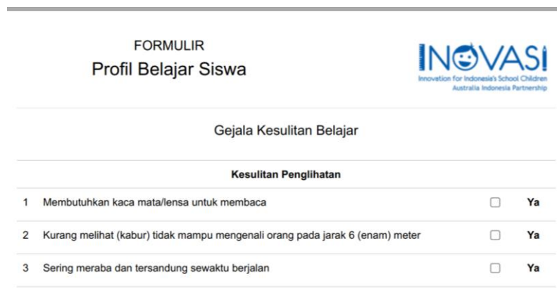
Gambar 1. Instrumen Profil Belajar Ssiswa (PBS)

Hasil penelitian ini berupa data identifikasi jumlah siswa dengan kesulitan fungsional belajar, langkah-langkah penanganan/pelayanan yang dilakukan guru, dan pihak madrasah, serta dampak penanganan/layanan pembelajaran guru terhadap perkembangan fungsional belajar peserta didik madrasah ibtida'iyah di Kabupaten Lombok Timur. Data ini diperoleh dengan melakukan observasi jangka panjang yang dilakukan oleh guru kelas menggunakan instrument PBS yang dikembangkan oleh Inovasi NTB dan melalui proses wawancara yang dilakukan oleh peneliti terhadap guru kelas. Sebelum melakukan observasi guru terlebih dahulu diberikan pelatihan sebagai upaya penyamaan persepsi bagaimana menggunakan instrumen dan melakukan analisis sehingga mendapatkan hasil yang akurat dan valid. Contoh format PBS dapat dilihat pada gambar berikut.